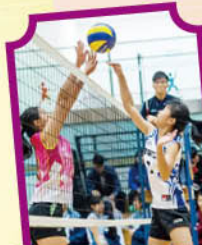
全港學界精英排球比賽