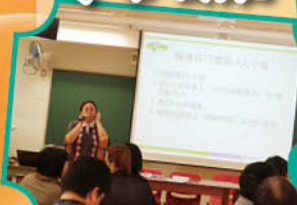
「生涯規劃」教師講座