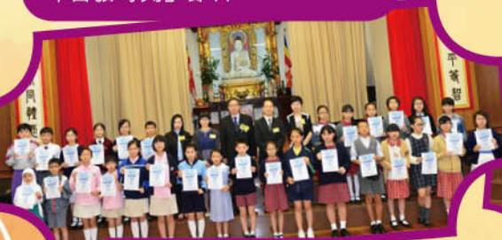
「細味人生」比賽頒獎禮