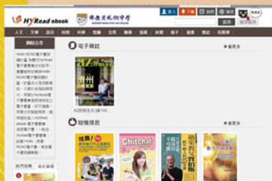
網上閱讀文化平台， 擴闊學生閱讀