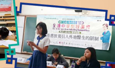
扶輪盃中學校際辯論比賽