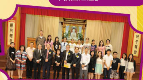
朗誦解碼暨「邁向成功」分享會