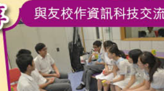
與友校作資訊科技交流