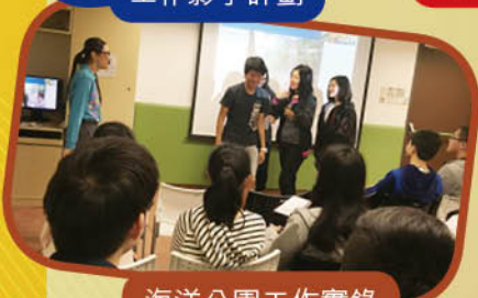
海洋公園工作實錄