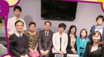
獲邀出席 DBS 數碼電台「校園巡禮」