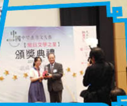
中國中學生作文大賽