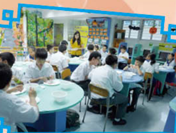
Table Manner Workshop