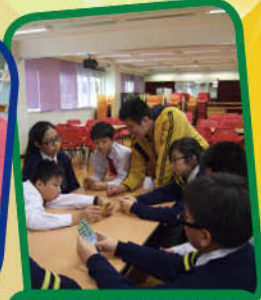
大哥哥大姐姐計劃