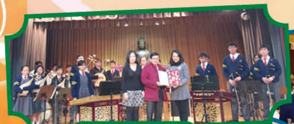
佛教慈敬學校表演