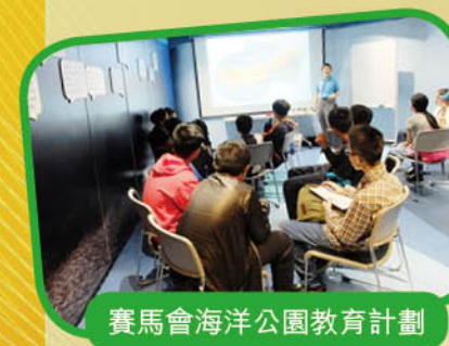
賽馬會海洋公園教育計劃