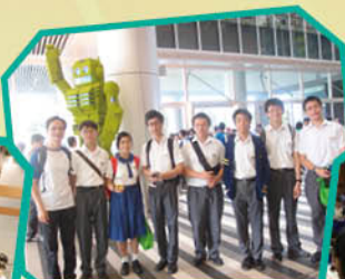
太陽能發電車大賽