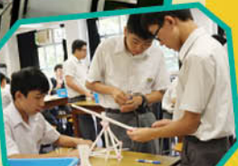
飲管羅馬炮架設計比賽