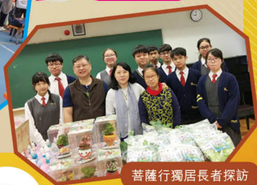
菩薩行獨居長者探訪