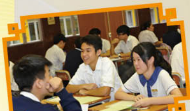
Joint School Speaking Day