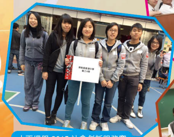
十面埋服 2015 社會創新服務賽