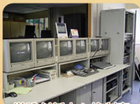
媒體創新中心控制室