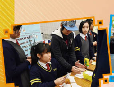
English Week Game Booth