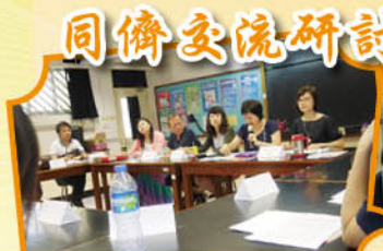
佛聯會會屬中學英文科會議