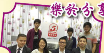
師生獲邀出席香港電台第五台「奮發時刻」節目