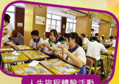
人生旅程體驗活動